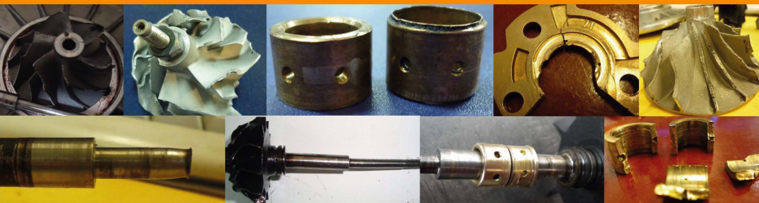
Surge or Shaft Motion Operation / Operación Irregular Debido a la Aplicación