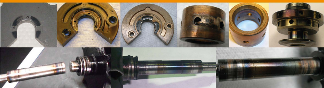
Lack of Lubrication or Oil Degradation / Deficiencia de Lubricación o Aceite Degradado