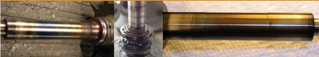
Hot Shutdown / Parada Caliente