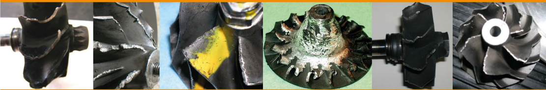
Foreign Body Ingestion / Ingestión de Objeto Extraño