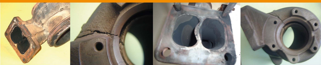
Excessive Exhaust Gas Temperature / Excesiva Temperatura de Los Gases De Escape