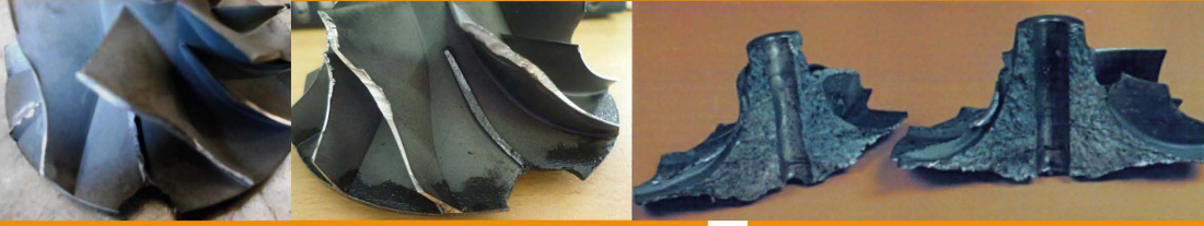
Broken Compressor Wheel / Quiebra Anormal de La Rueda Compresora